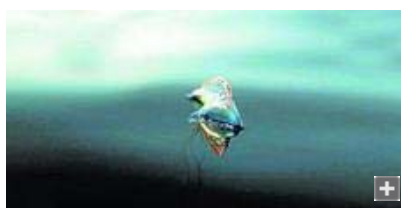
Un ejemplar de 'fragata portuguesa', ayer en Catalan Bay.

El Gobierno de Gibraltar alertó ayer de la presencia en las aguas que rodean el Peñón de varios especímenes de fragata portuguesa, un sifonóforo con apariencia de medusa altamente peligroso que también recibe el nombre de burbuja o botella azul.