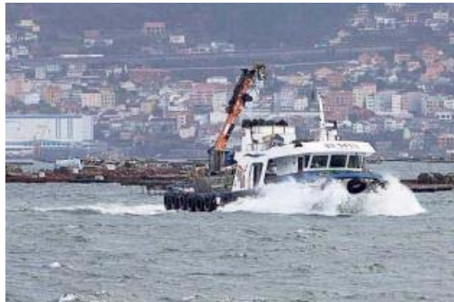
Un barco bateiro faenaba ayer en Moaña.