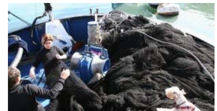
Una neskatilla cose la red del 'Motxo', en el puerto de Bermeo, para poder salir a faena.

Aunque tras cinco años de veda la costera de la anchoa arrancó oficialmente ayer para las embarcaciones del Cantábrico, la flota no comenzará esta pesquería, «como muy pronto», hasta mediados de mes. La temperatura del agua es demasiado baja todavía para que aparezca el bocarte y, según los arrantzales, «sería una sorpresa que alguien pescara anchoa en los próximos días». Entretanto, los barcos se encuentran inmersos en la campaña del verdel, con importantes descargas.