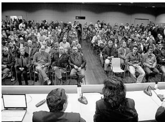
Un momento de la reunión entre los responsables de la Xunta y los productores de mejillón.

MANUEL MÉNDEZ | A CORUÑA El sector mejillonero gallego está unido contra el nuevo método analítico de biotoxinas marinas que trata de imponer la UE. Así lo demostró ayer en una reunión con representantes de la Consellería do Mar -a la que asistieron medio millar de representantes de agrupaciones bateeiras, empresas del sector transformador y cofradías- para analizar la "firme amenaza" que supone para los profesionales gallegos la propuesta del Ejecutivo comunitario.